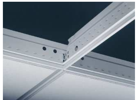
Ossatures Interlude XL 2